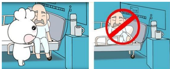
要有人扶您下床喔！ 不可以自己下床