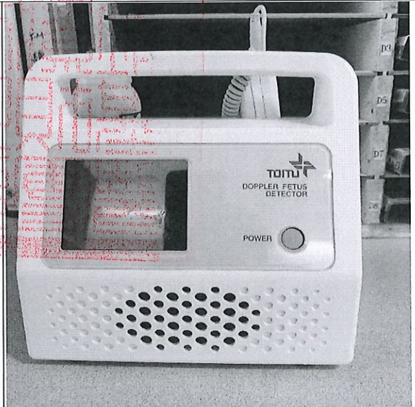
觸控液晶式胎心音測定儀