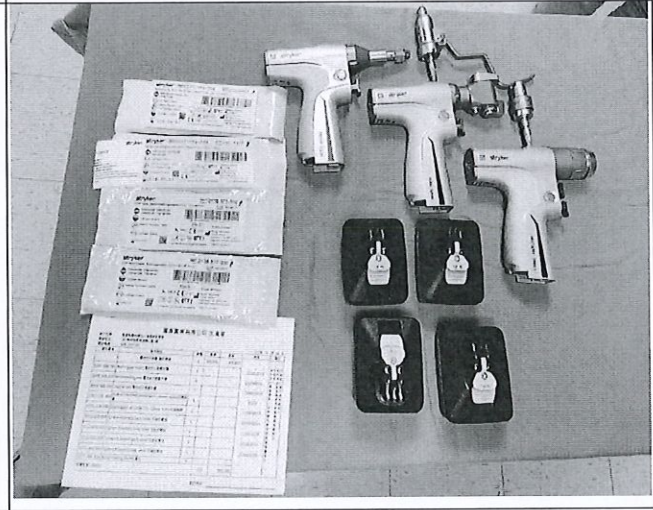
電池式大骨鑽/鋸手機組